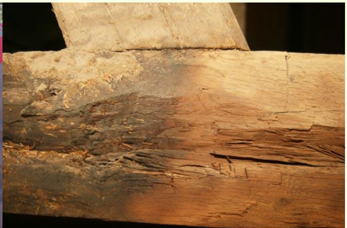
Reinigen van verweerd hout