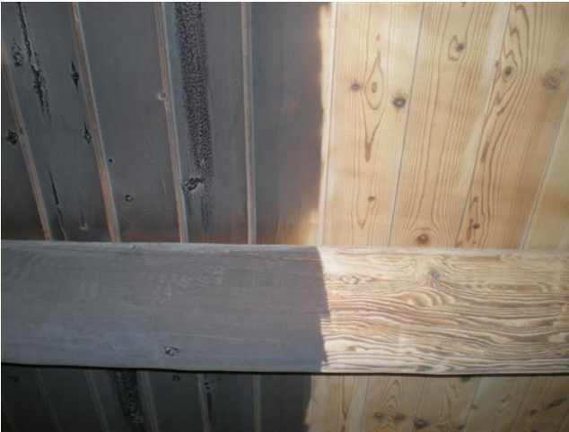
Verwijderen dunne verflagen van zachte houtsoorten