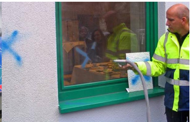
Graffiti van glas met sod