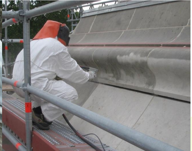
De voet van de Eiffeltoren in Parijs.