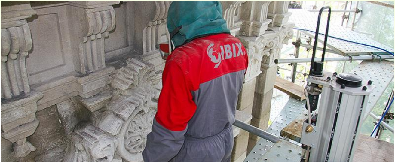
Natuursteen met bewerkelijke ornamenten