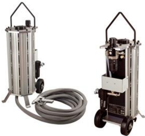
De gepatenteerde IBIX® ketel is compact, lichtgewicht en word geleverd met 5 jaar garantie.

IBIX® voldoet aan alle bovenstaande punten. Niet voor niets word het IBIX® systeem door zeer veel bedrijven ingezet voor veel uiteenlopende luchtgom – werkzaamheden zowel mobiel als op een vaste locatie