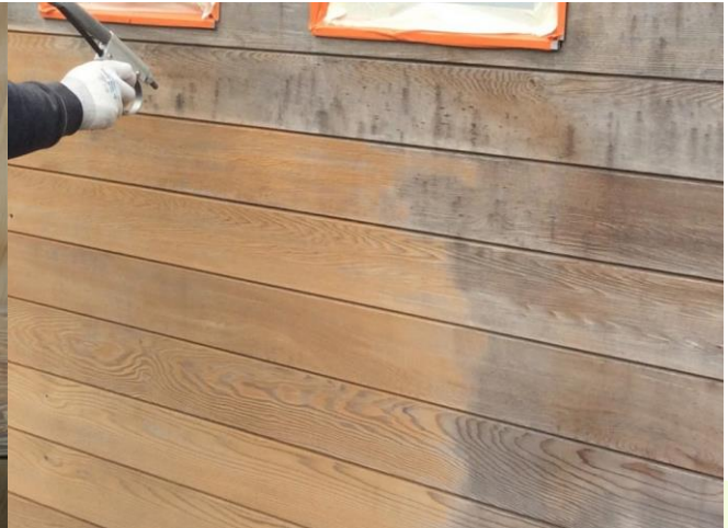
Reinigen van verweerd hout