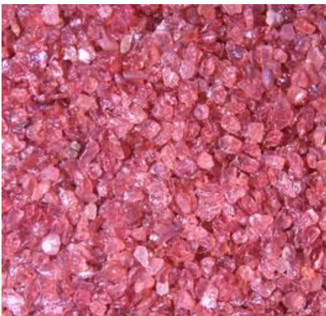
Microscopafbeelding van GMA ® Garnet waarin de “diamantvorm” goed zichtbaar is.