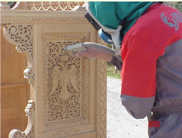
Luchtgommen van houtsnijwerk