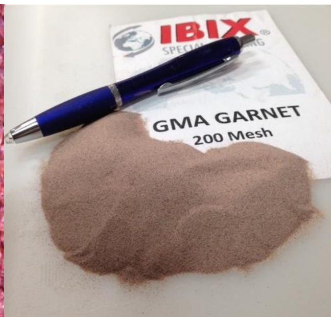
Afbeelding die laat zien hoe fijn het straalmiddel is.