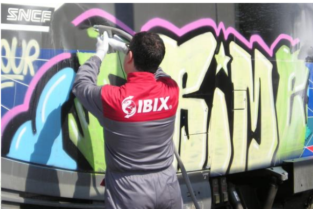
Graffiti van treinwagon met soda onder zeer lage druk