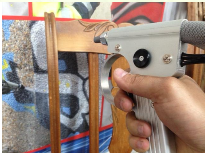
Handzaam pistool met lichtgewicht straalslang maakt het mogelijk om zeer precies te werken met een lage lichamelijke belasting.